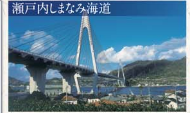
瀬戸内しまなみ海道