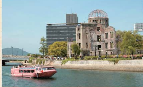
平和記念公園と原爆ドーム

別名を鯉城(りじょう)と呼ばれ親しまれている広島城は、広島市中心部に位置し、全城が広島城址公園となっています。復元された天守閣は歴史博物館となっており、天守閣から市内を一望することができます。