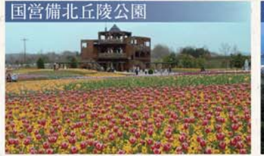
国営備北丘陵公園