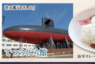
ちよつと 寄り道 10分の1縮尺の潜水艦 大和ミュージアム 潜水艦博物館 てつのくじら館 海軍カレー

呉といえばココ! 呉市中心部には、「大和ミュージアム」や「てつのくじら館」などの話題のスポットあり! また、肉じゃがや海軍カレーなどの海軍グルメもお楽しみいただけます。