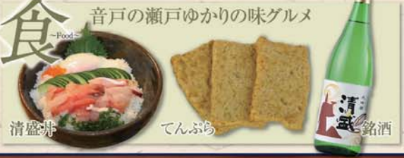
音戸の瀬戸ゆかりの味グルメ 清盛丼 てんぷら 銘酒